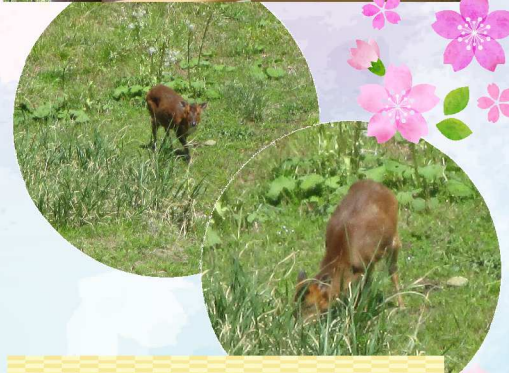
お花見中にキョンに遭遇